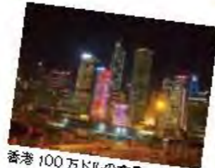
香港 100万ドルの夜景