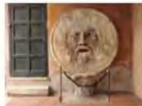
ローマの「真実の口」