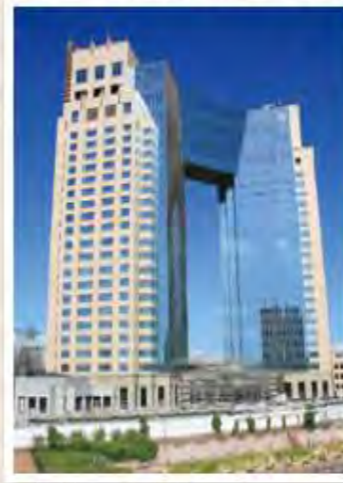
東京ベイコート倶楽部

栃木県那須のコテージ、お台場の会員制ホテル&スパリゾート「東京ベイコート倶楽部」など、多くの保養所があります。