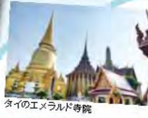
タイのエメラルド寺院