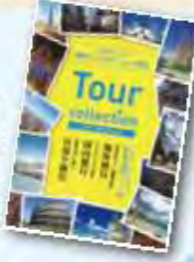
カマチグループ ツアーコレクション