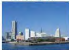
横浜港のクルージング