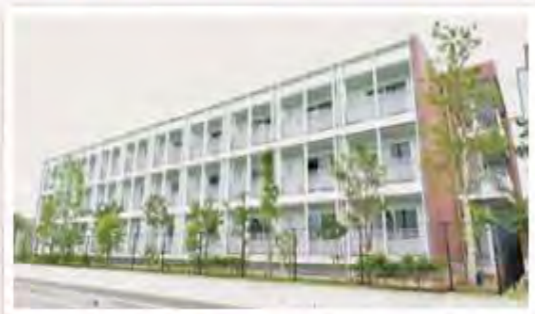
新久喜総合病院 職員寮

福利厚生の一部として夜勤ができる看護補助者が利用できます。ほとんどが病院から徒歩圏内にあり、オートロック付マンションなので侵入者の心配もありません。また、相場よりお安く借りることができます。