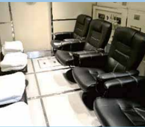
▲広々としたラグジュアリーな内部