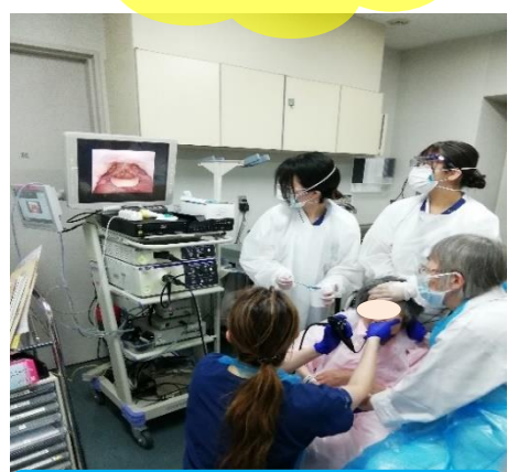
VEによる嚥下機能検査